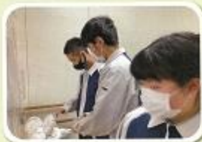
3年「農園芸班・さつまいも販売」