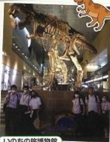
いのちの旅博物館

いのちの旅博物館に行きました。化石やティラノサウルスの標本の大きさに感動しました。最高の思い出になりました。