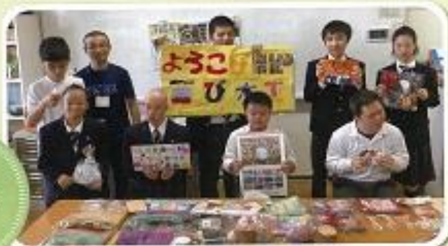
2.3年軽作業班「手作り品の販売がんばりました」