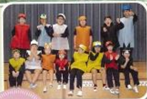
5年「ピーターとおおかみ」