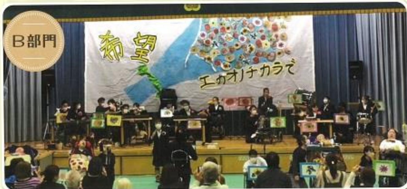
「希望～エガオノチカラで～」