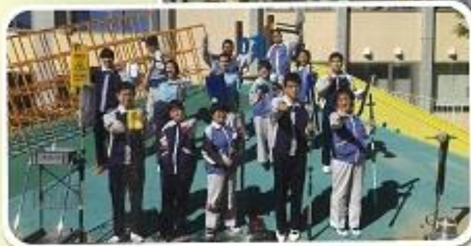
2.3年清掃班 「クリーンレンジャー参上!!」 当日発表前の集合写真