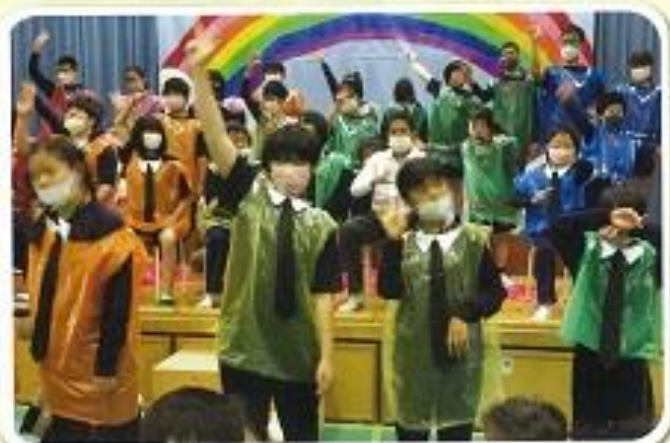
1年「虹：明日への一歩を踏み出そう」