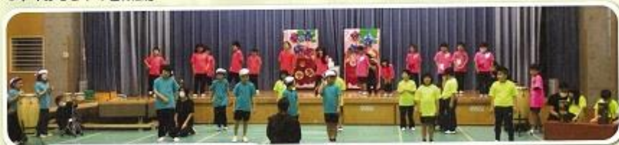
4年「みんなdeパーティ！」