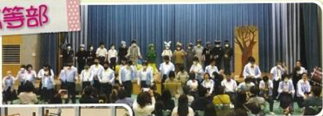
1年「てぶくろ〜ツバメが見たてぶくろの中は〜」