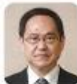
感動と喜び、 笑顔と感謝があふれる 校長

「3歩目をジャンプ」と呼びます。みなさんは小学部からホップ、中学部からステップ、高等部から大きくジャンプをし、それぞれの輝かしい未来へ跳躍をします。おりしも今年は兔年です。みなさんが新しいステップに向けてより飛躍できることを願っています。 保護者の皆様、お子様の「卒業」誠におめでとございます。PTAが今年度も無事に年間を過ごすことができましたのは、ひとえに皆様の「理解」と「協力のおかげ」です。ありがとうございました。