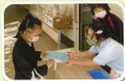
3年「紙工班・うちわ販売」