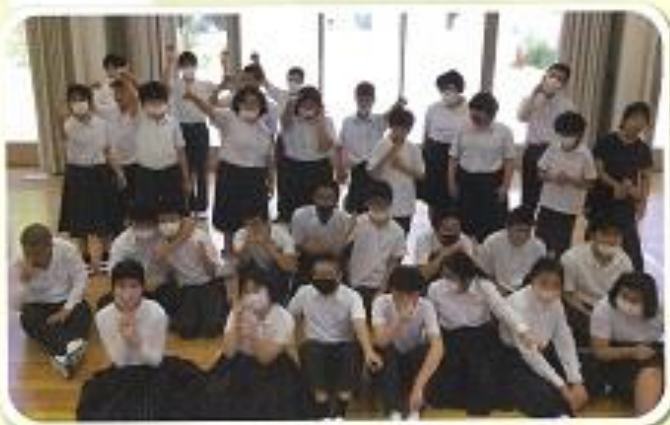
3年「希望の歌を届けよう～Bright The Star」