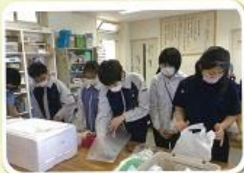
2.3年陶芸「販売大忙し」