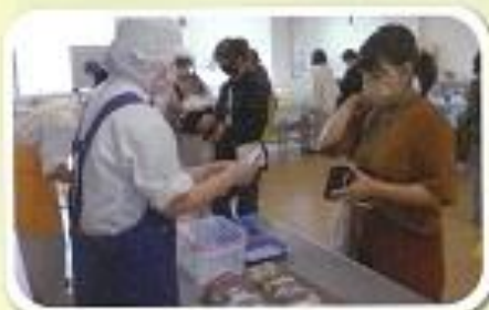
2.3年食品縫製班「焼き菓子販売」