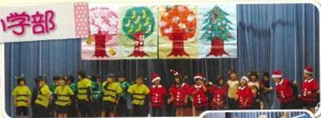
2年「2年生の春夏秋冬」