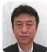
ホップ！ ステップ！ジャンプ！ PTA会長

卒業生のみなさん、「卒業おめでとう」といいます。みなさんはこの春、次のステップに進みます。新しい世界に不安もあるでしょうが、大丈夫です。これまで学校で学んできたことを上手に生かしていきたいと思います。