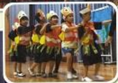
1年 「おしえて！ みんなのすきなこと」