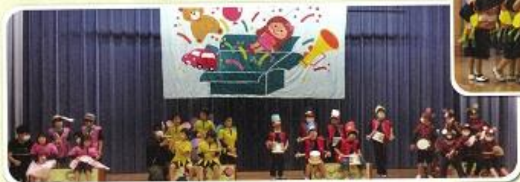
3年「おもちゃの音楽会」