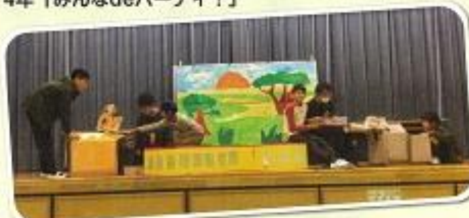
6年「楽しかった修学旅行！」