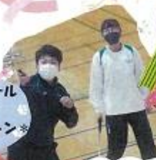
西高スクール マッチ *バドミントン*

勉強きらいだ、ちやん 3年間よく頑張ったね♡? たくさんの友達と出会えて良かったね この先も、らしく頑張ってください 大好きだよ、ちやん♡