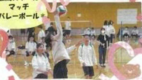
西高スクール マッチ *バレーボール*