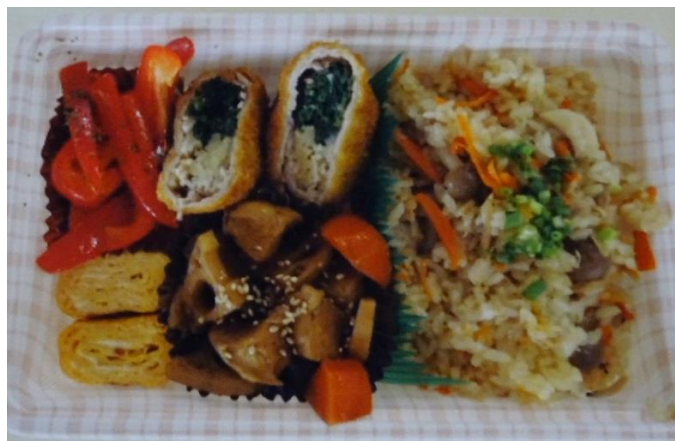
れんれんのお弁当（久留米市外三市町高等学校組合立三井中央高等学校）